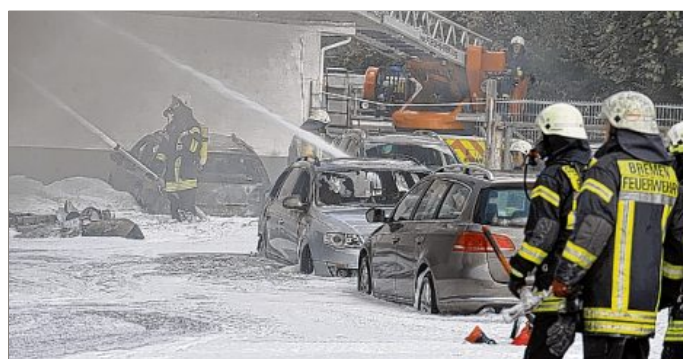
Feuerwehrmänner löschen die Lagerhalle des Autohauses, in die das Kleinflugzeug gestürzt war.

BREMEN / LNI - Unmittelbar nach dem Start ist gestern ein Kleinflugzeug im Bremer Stadtteil Huckelriede auf das Gelände eines Autohauses gestürzt und explodiert. Die beiden Männer im Cockpit starben. Die Maschine war nach Augenzeugenberichten am frühen Nachmittag fast senkrecht in ein Lagergebäude mit Reifen gekracht. Die Feuerwehr hatte Mühe, den Brand mit einem Großaufgebot an Löschkräften unter Kontrolle zu bringen. Rund