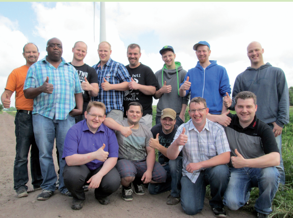
To byli kandydaci startujący z listy nr 1 do wyborów rady zakładowej w lipcu 2014 roku pod hasłem: »O wspólny GZO«.