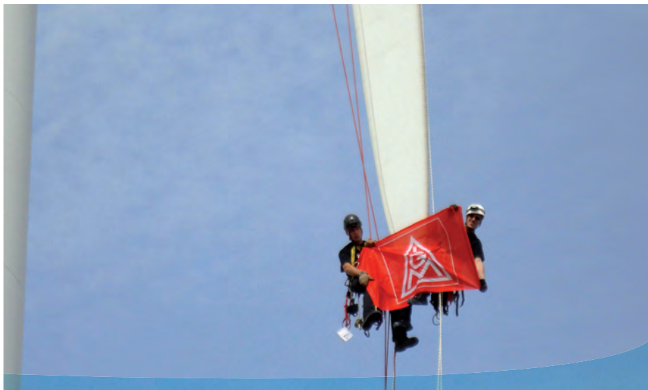
Die IG Metall kennt sich aus in der Windbranche.